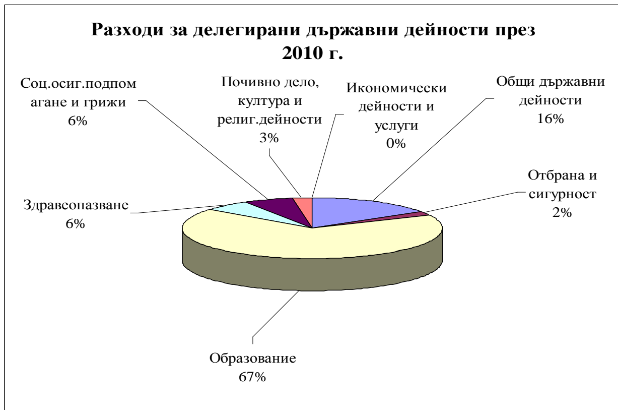
Графика № 1

Структурата на разходите за държавните дейности е видна от Графика № 1